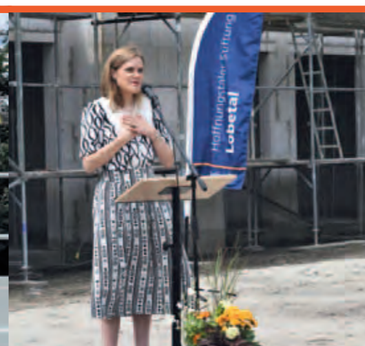
Schauspielerin und Schirmfrau Fritzi Haberland betonte die Menschlichkeit, die von diesem Ort ausgehen wird.

land betonte die Menschlichkeit, die von diesem Ort ausgehen wird. „Dies ist ein wichtiger Gegenpol zu Strömungen, die Hass streuen und die Gesellschaft spalten. Hier entsteht ein Ort des Miteinanders, der Menschlichkeit, Fürsorge und Wärme. Das gibt mir Hoffnung.“