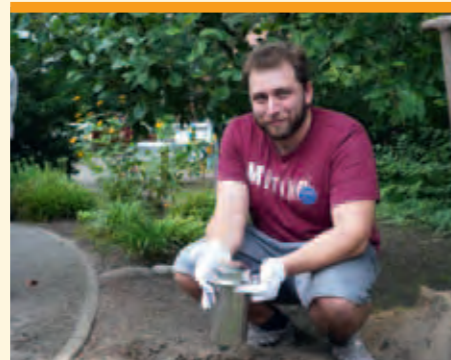
Eine Zeitkapsel mit guten Wünschen für die Zukunft wurde unter einem zum zehnten Hausgeburtsfest gepflanzten Apfelbaum in die Erde gelegt.