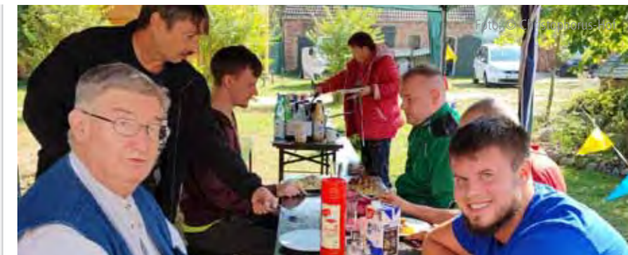
Gemeinschaft erleben, Freizeit sinnvoll gestalten: Das sind wichtige Anliegen der Projektwoche der Suchthilfe.