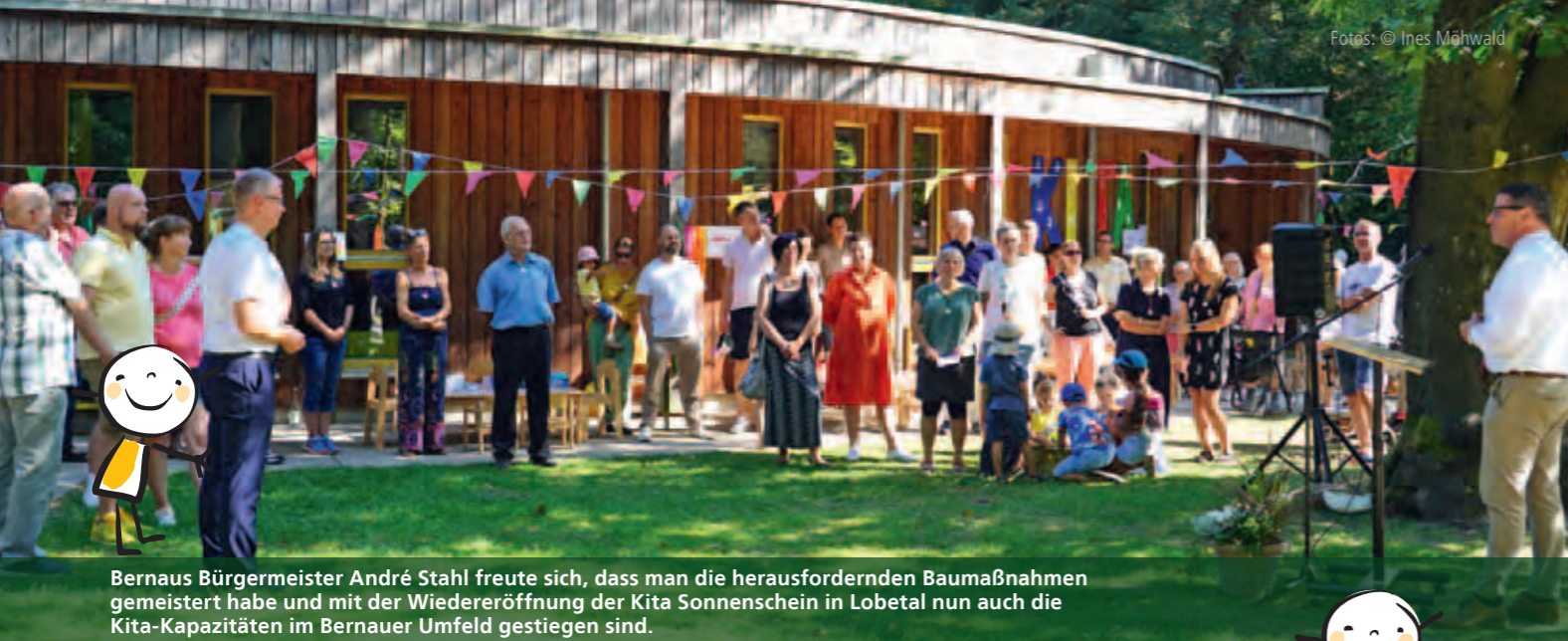
Bernau Bürgermeister André Stahl freute sich, dass man die herausfordernden Baumaßnahmen gemeistert habe und mit der Wiedereröffnung der Kita Sonnenschein in Lobetal nun auch die Kita-Kapazitäten im Bernauer Umfeld gestiegen sind.