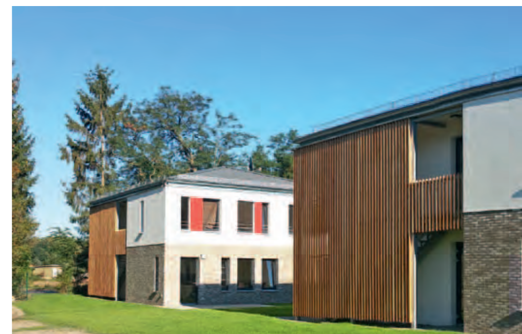
Die neuen Häuser des Wendepunkt wurden 2016 eingeweiht.

„Schritt für Schritt, lernen im eigenen Tempo, Rückschläge aushalten, wieder aufstehen, weitergehen, Hilfestellung geben, neue Orientierung, motivieren nicht