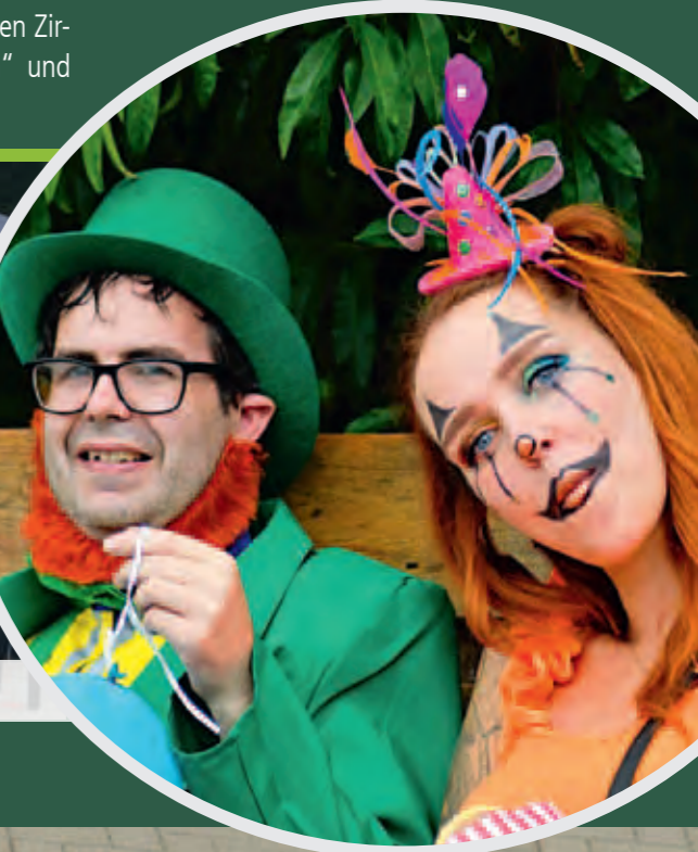
Der Müllerberg in Eberswalde verwandelte sich beim Sommerfest in eine Zirkuslandschaft: Artistik, Zauberei, Tierschau und Spaßgarantie waren die Zutaten.