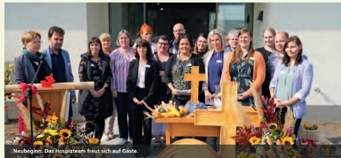
Neubeginn: Das Hospizteam freut sich auf Gäste.