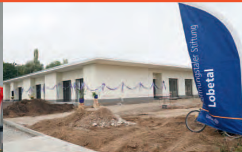
Das Hospiz ist ein einstöckiges Gebäude. Sechzehn geräumige und helle Einzelzimmer sind im Rechteck angeordnet und umgeben ein Atrium. Eine überdachte barrierefreie Terrasse erlaubt es, im Bett die Natur zu erleben.