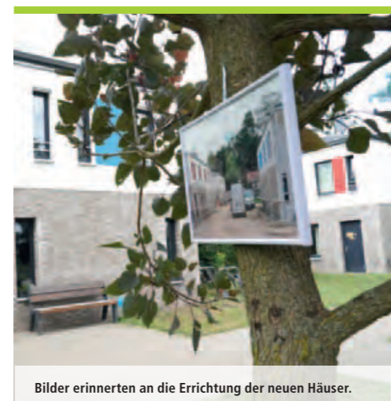
Bilder erinnerten an die Errichtung der neuen Häuser.