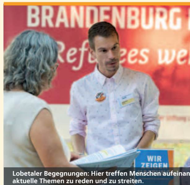
Lobetaler Begegnungen: Hier treffen Menschen aufeinander über aktuelle Themen zu reden und zu streiten.