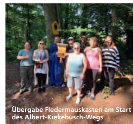
Übergabe Fledermauskästen am Start des Albert-Kiebusch-Wegs

Eine Naturschutzaufgabe ist es, den dabei entstandenen Lebensraumverlust für streng geschützte Fledermäuse, die auf Baumhöhlen angewiesen sind, diese jedoch nicht selbst bauen können, zu kompensieren. Denn Fledermäuse sind nicht nur unheimlich niedlich, sondern auch unheimlich nützlich – sie tragen mit ihrem Appetit auf Insekten wesentlich zur Gesundheit des Ökosystems Wald bei.