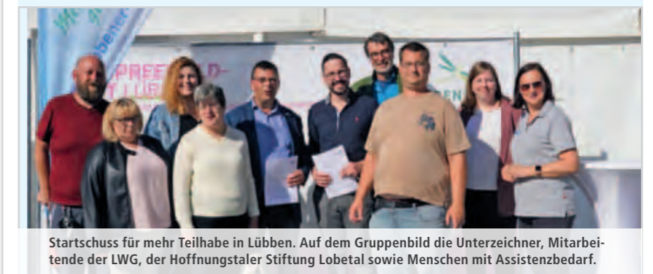
Startschuss für mehr Teilhabe in Lübben. Auf dem Gruppenbild die Unterzeichner, Mitarbeitende der LWG, der Hoffnungstaler Stiftung Lobetal sowie Menschen mit Assistenzbedarf.