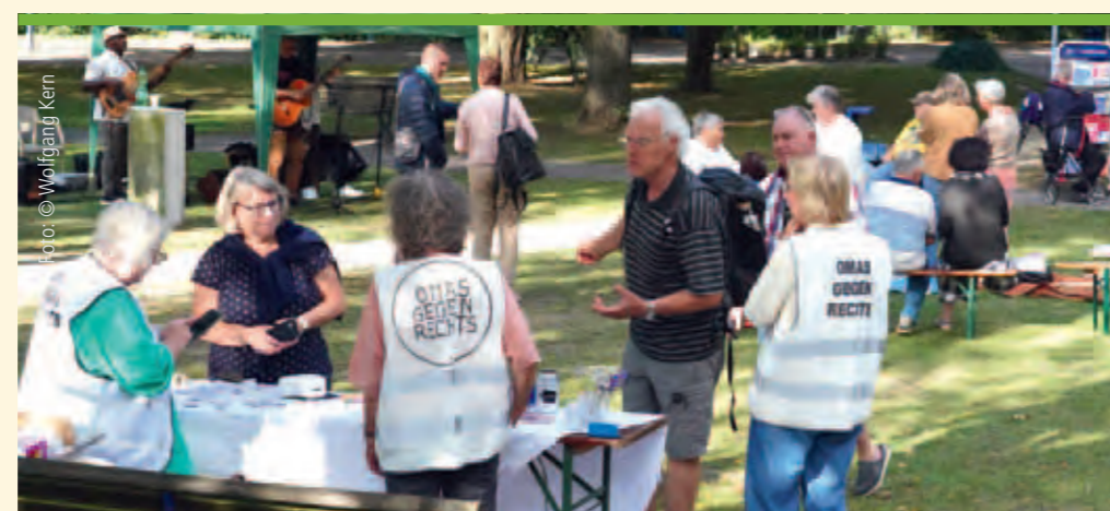
Die „Wandlitzer Omas gegen Rechts“ Fallbeispiele im Ringen für Demokratie und gegen Ausgrenzung an Blättern auf Schnüre gehängt, die schnell Aufmerksamkeit fanden und zum Dialog anregten.

Abgeschaut hatten sich beide diese Idee ein wenig von den „Omas gegen Rechts“ aus der Großgemeinde Wandlitz. Die orga-