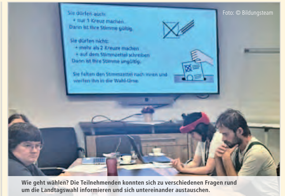
Wie geht wählen? Die Teilnehmenden konnten sich zu verschiedenen Fragen rund um die Landtagswahl informieren und sich untereinander austauschen.