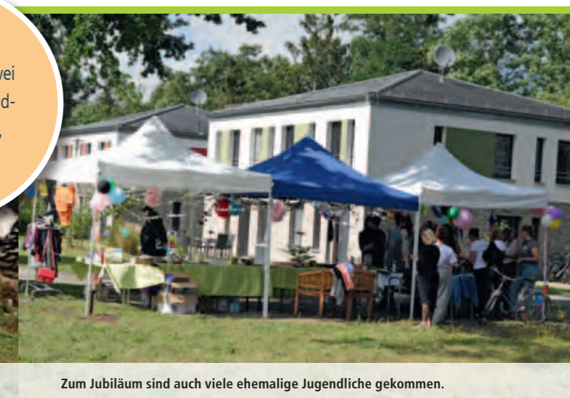
Zum Jubiläum sind auch viele ehemalige Jugendliche gekommen.