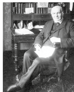
Friedrich von Bodelschwingh (1831–1910)

Die Vision der v. Bodelschwinghschen Stiftungen Bethel ist das selbstverständliche Zusammenleben, das gemeinsame Lernen und Arbeiten aller Menschen in ihrer Verschiedenheit: Mehr oder weniger gesunde, mehr oder weniger behinderte, mehr oder weniger leistungsfähige, jüngere und ältere Menschen, Menschen unterschiedlicher kultureller Herkunft und religiöser Prägung sollen als Bürgerinnen und Bürger mit gleichen Rechten und Chancen in der Gesellschaft leben.